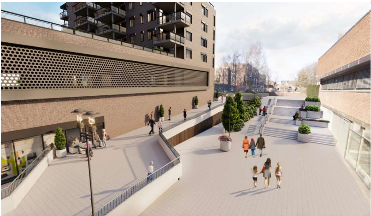
Figur 3 Illustrasjon utarbeidet i regi av Lietorvet boligutvikling