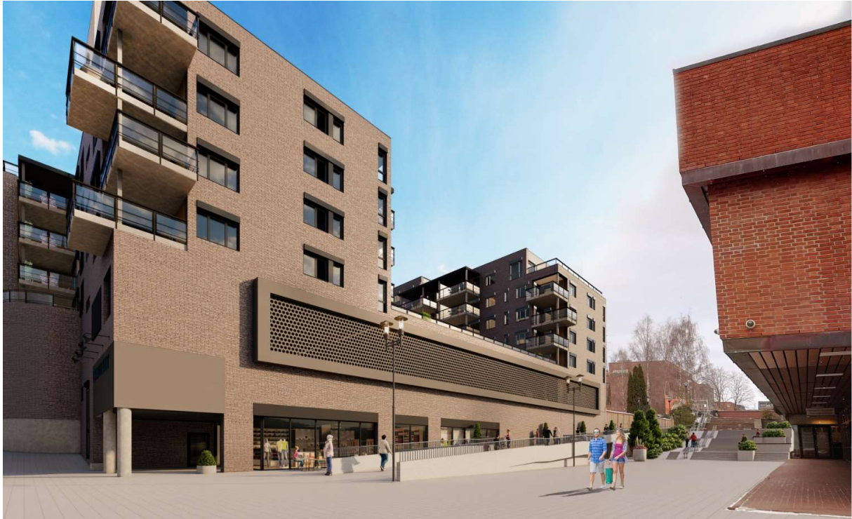
Figur 2 Illustrasjon utarbeidet i regi av Lietorvet boligutvikling