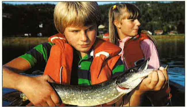
Gjeddefiske i Børsesjø har lenge vært populært.