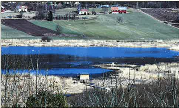
Fugletårnet er plassert slik at man har god utsikt over sjøen.