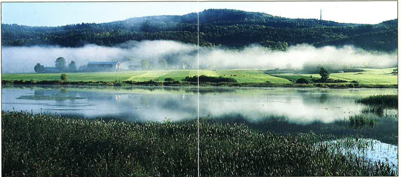
Børsesjø, en perle i et storslått kulturlandskap.