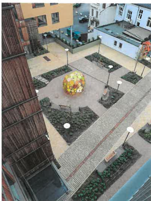
«Byrommet» ved Kverndalen Bo- og Servicesenter