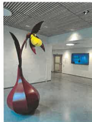
Fra inngangspartiet på Kverndalen Bo og servicesenter