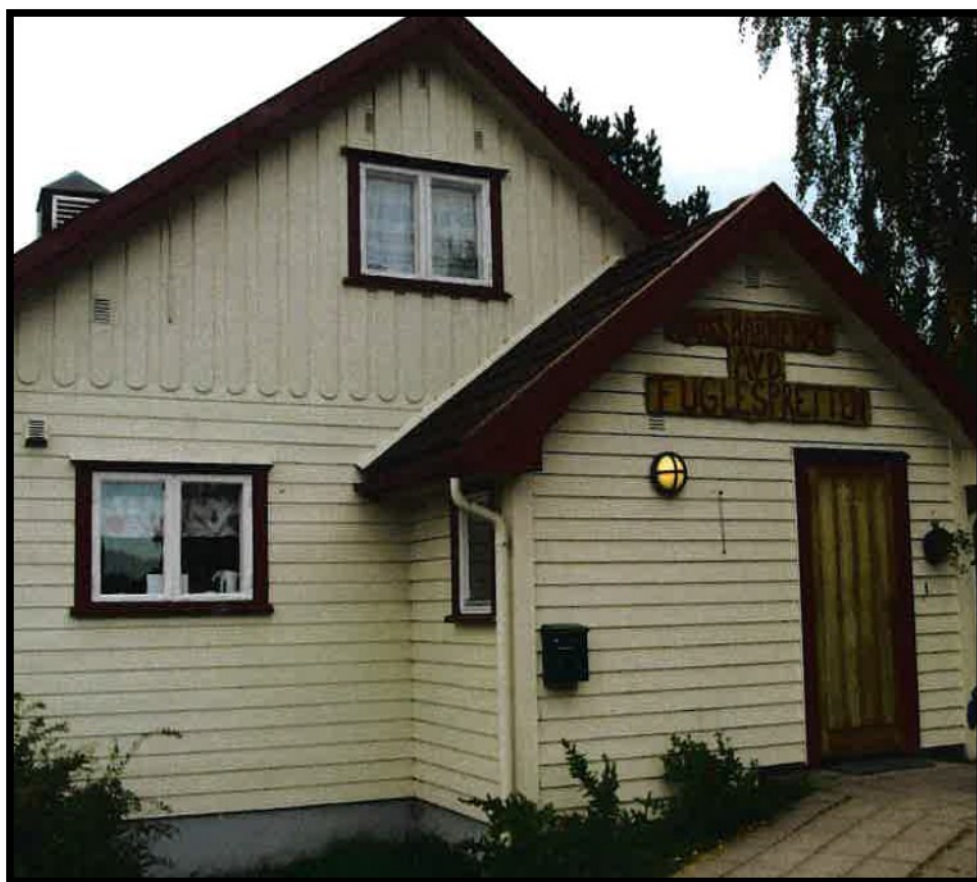
ÅFOSS BARNEHAGE, AVDELING FUGLESPRETTEN