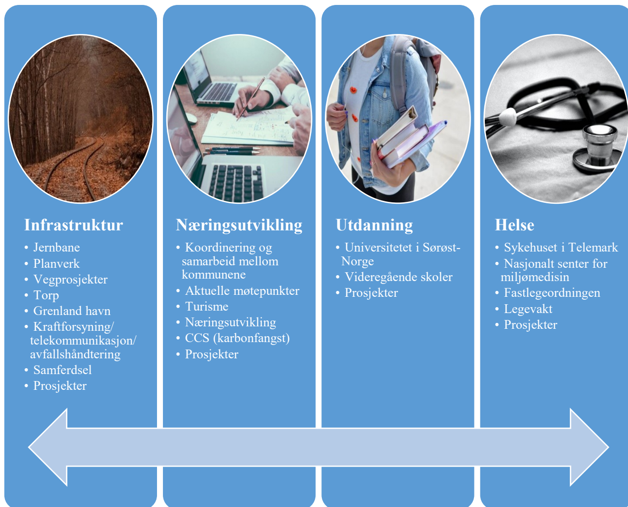
Figur 2. Satsingsområder for Grenlandssamarbeidet.

Under Grenlandsrådet den 10. og 11. januar 2019 (sak 4/19 og 5/19) ble rådet enige om fire overordnede satsingsområder for samarbeidet. Disse fire er infrastruktur, næringsutvikling, utdanning og helse. Områdene har gitt en plattform for videre arbeid, og danner i hovedsak rammeverket for samarbeidets fokusområder.