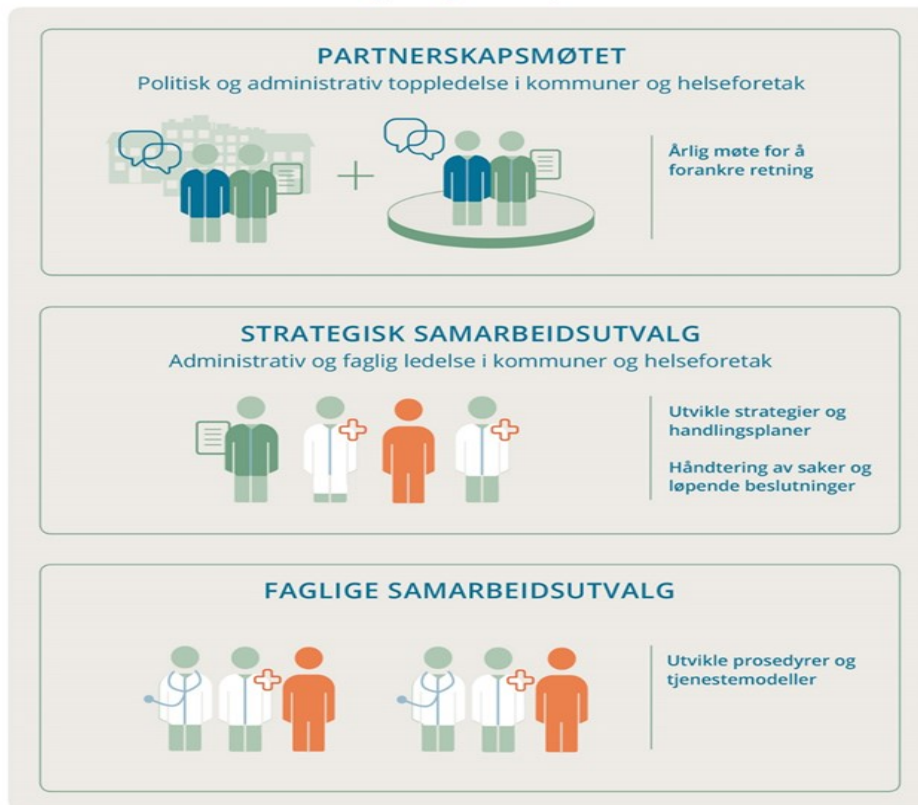
Figur 3. Organisering av Helsefelleskap

Brukere og fastleger deltar på alle nivå