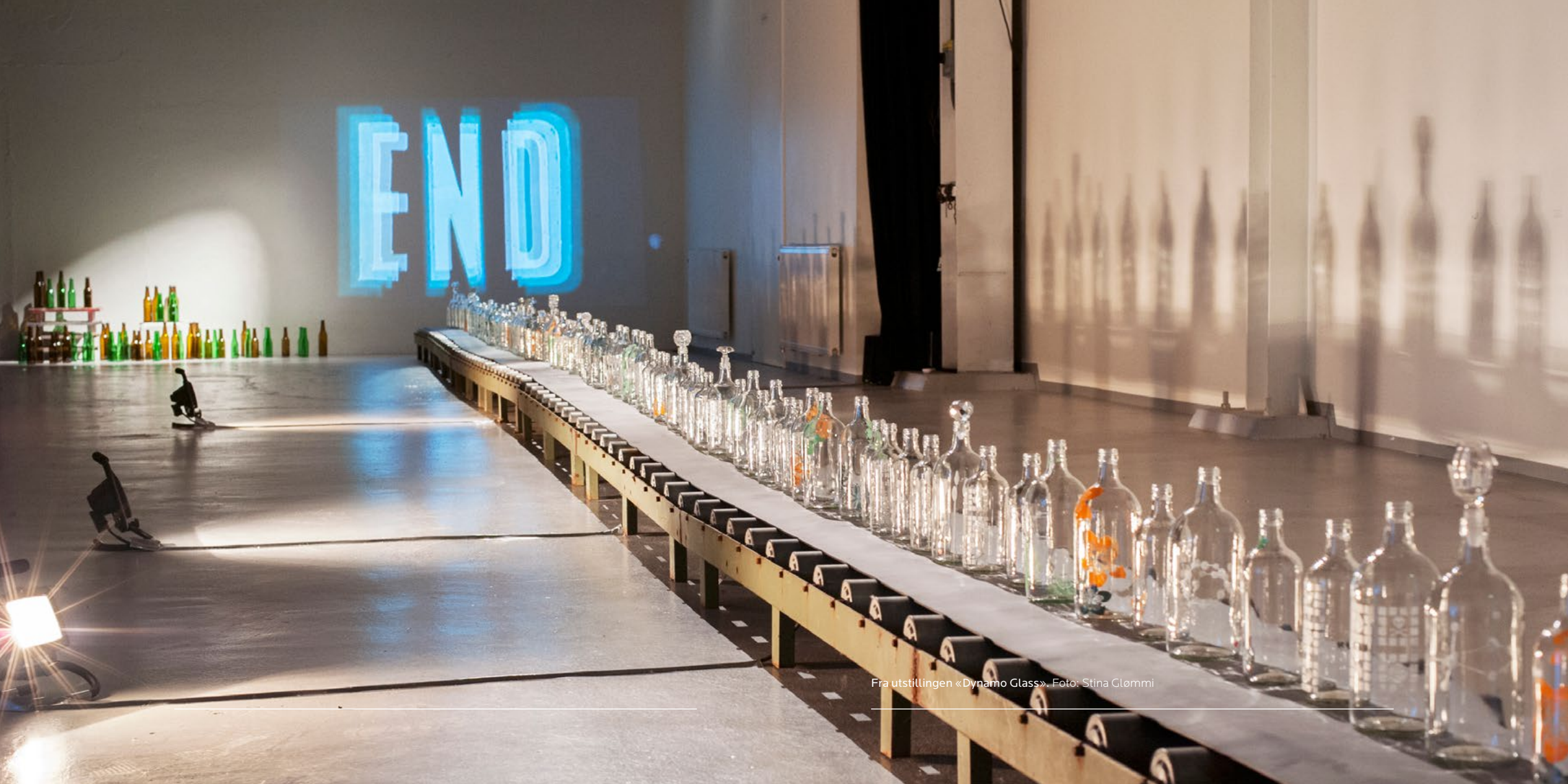
Fra utstillingen «Dynamo Glass».